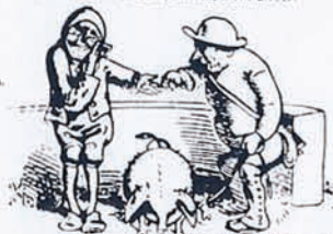
„Se'n twintig Daler, heb ik dacht!“ Hier sind sie, fertig, abemacht“