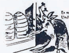
Es schnuppert keck in allen Ecken Und schaut sich an den Bienenstöcken.