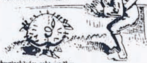
Der Schweinekäufer steht vorüber: Was wollt ihr für das Schwein, mein Lieber?